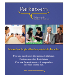
Manuels de travail pour les patients, imprimés ou en ligne