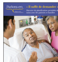
Fiche d'aide à la discussion « Il suffit de demander »