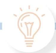
TABLE DES MATIÈRES